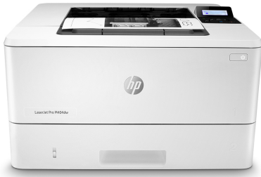
HP LaserJet Pro M404dw

Для успеха в бизнесе необходимо работать умнее. Принтер HP LaserJet Pro M404 разработан, чтобы позволить вам сосредоточиться на важнейших задачах — развитии бизнеса и опережении конкурентов.