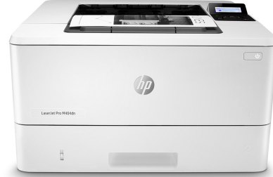
HP LaserJet Pro M404dn

Принтер с поддержкой динамической безопасности. Предназначен для использования только с картриджами, оснащенными оригинальной микросхемой HP. Картриджи с микросхемами других производителей могут не работать, а работающие в настоящее время могут не работать в будущем. Подробнее см. на веб-сайте по адресу: